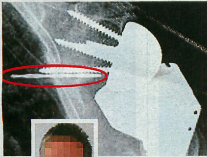
Deutlich ist im Röntgenbild zu erkennen, dass außer den drei Schrauben auch eine Bohrer-Spitze (rot) im Knochen steckt